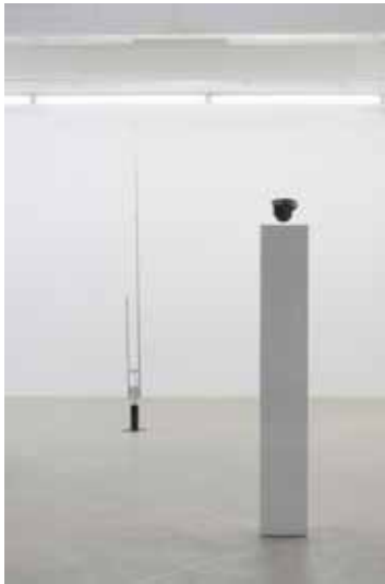
Endless Second and 88,7 (title variable)

In 88,2 MHz – de titel verandert al naar gelang de frequentie van de radio die wordt gebruikt wanneer het werk wordt getoond – zendt een cassettespeler gekoppeld aan een radiozender het geluid uit van stille pauzes. Deze stiltes zijn overgenomen uit verschillende radio-uitzendingen van politieke, intellectuele en economische speeches. Deze tape met de compilatie van stiltes is tevens een echt werkende versie van het fictieve werk dat in de novelle Collected Silences Murke's (1955) van Heinrich Boll wordt beschreven.