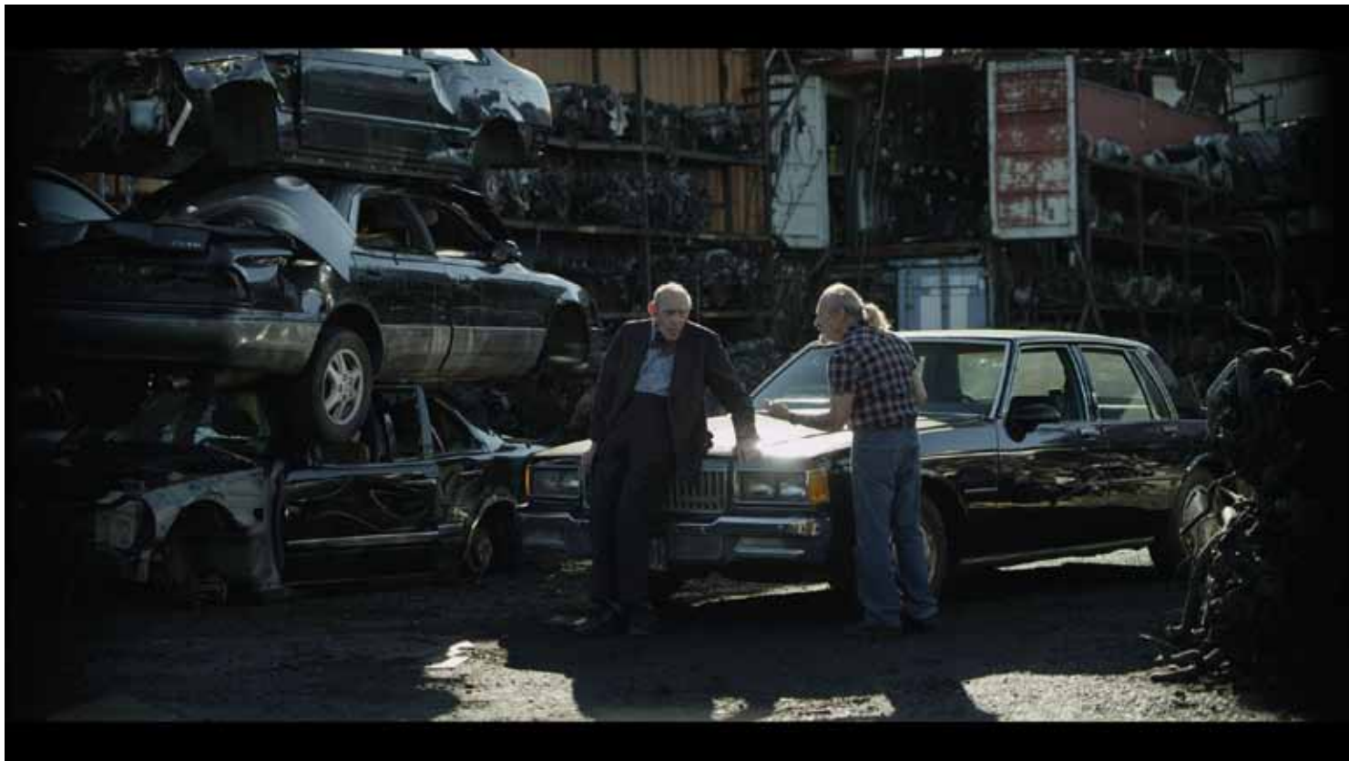
Cutaways , 2013. Cinematografie: Michael Simmonds. Courtesy Anna Lena Films, Tanya Bonakdar Gallery en Fortes Vilaca Gallery