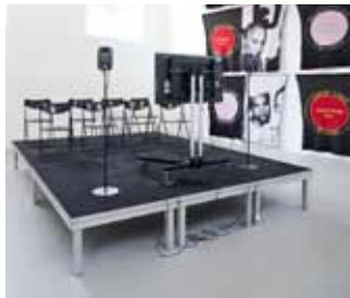
Foto: James Richards Active Negative Programme (2009) and Untitled Merchandise (Lovers and dealers) (2007), The Imaginary Museum , Kunstverein München

kunstenaars. Ook zal hij een aantal van de thema's uit het werk van Kurant aanstippen. Recente solotentoonstellingen van Richards waren te zien bij Rodeo, Istanbul; Spike Island, Bristol (2013); CCA Kitakyushu (2012); Chisenhale Gallery, Londen en Rodeo, Istanbul (2011). Recente groepstentoonstellingen: The Encyclopedic Palace , Venice Biennale (2013); Lyon Biennale (2013); Frozen Lakes , Artists Space, New York (2013) en The Imaginary Museum , Kunstverein München (2012). Als curator heeft hij screenings georganiseerd bij instituten als Light Industry, New York en de ICA, Londen. In 2012 kreeg hij de Jarman Award voor film en video. Op dit moment verblijft hij in Berlijn als deelnemer van het DAAD Berliner Künstlerprogramm.