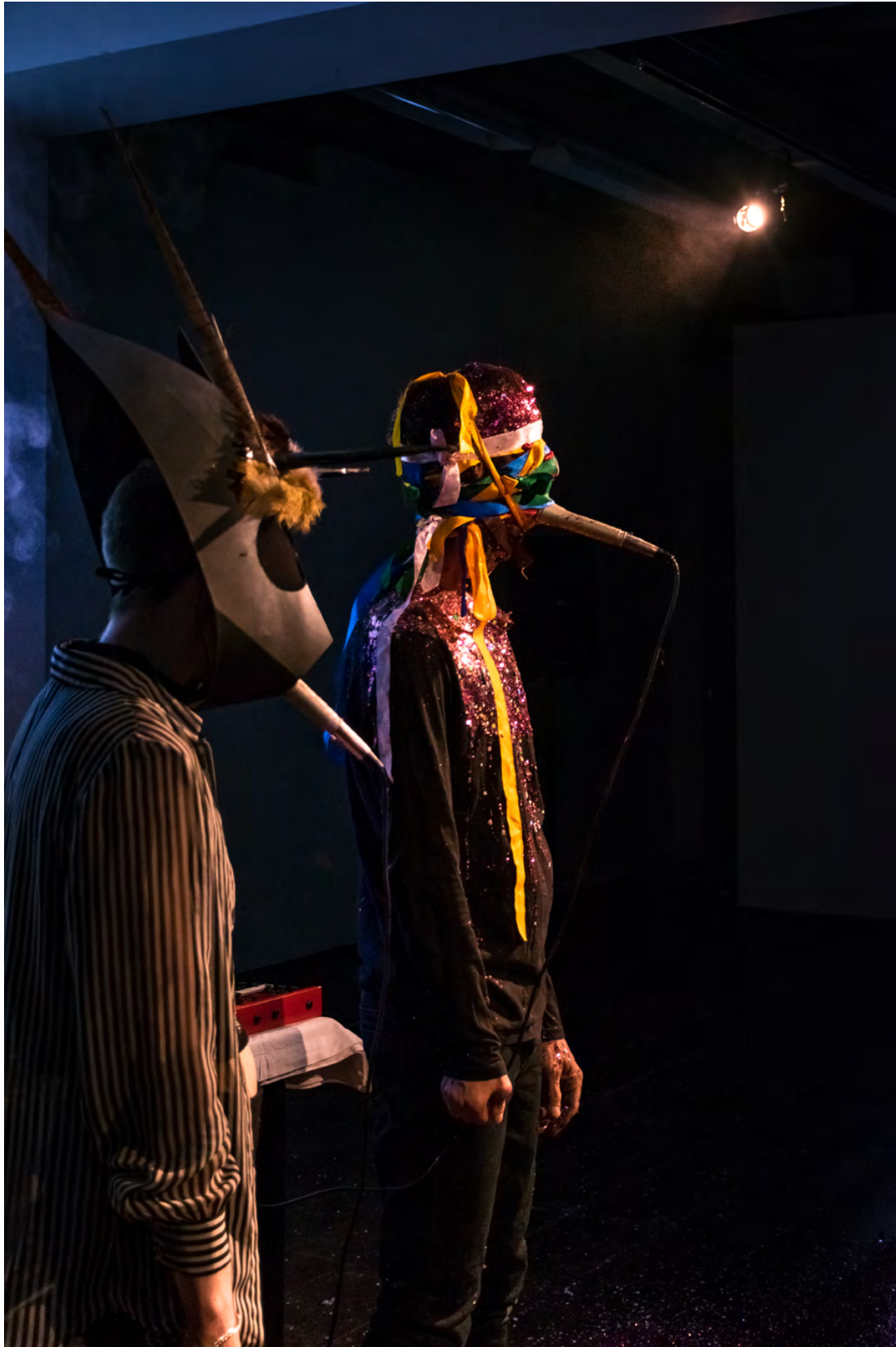
Manifestatie: WeberWoche : performance Plastique Fantastique , Myth Science Sound