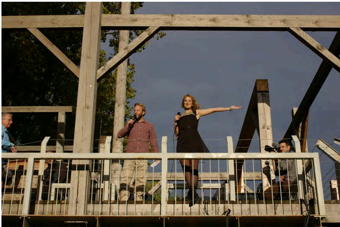
See You in The Hague: concert Peace and Justice Songs on Scaffold