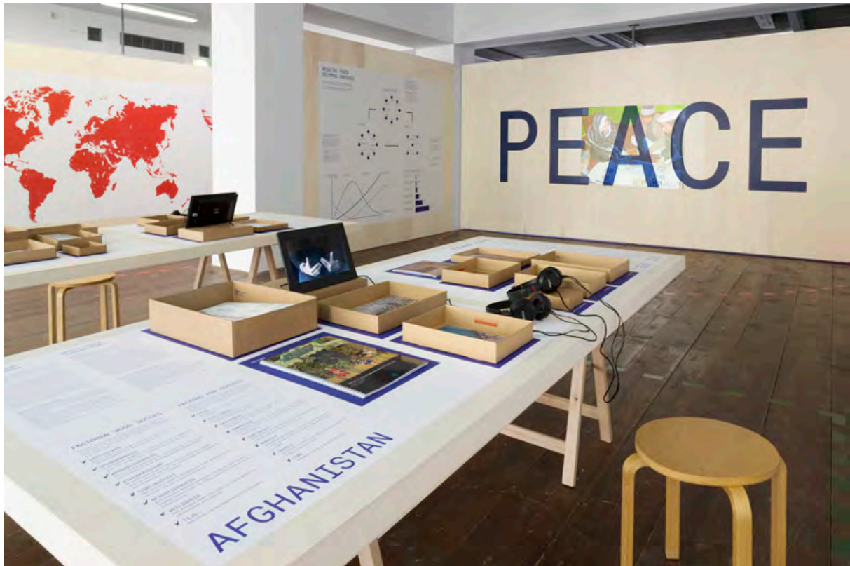
Tentoonstelling: The Good Cause