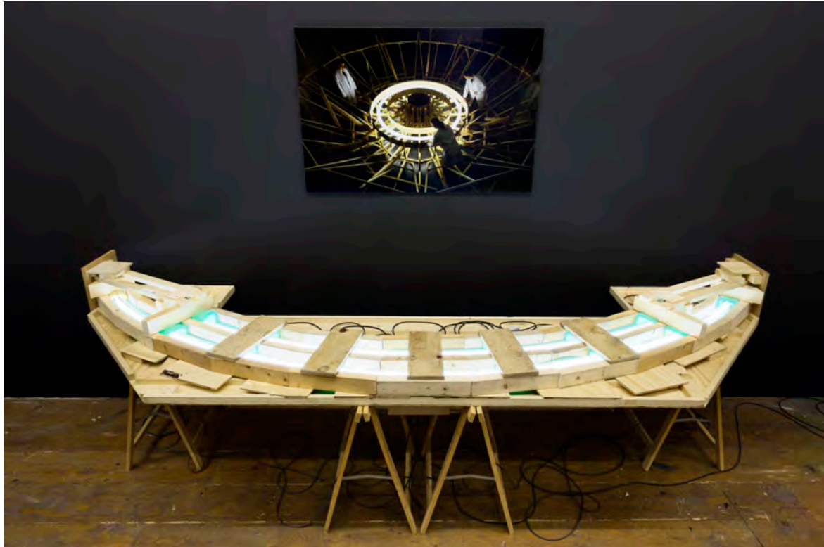
Ondertussen: Thijs Ebbe Fokkens