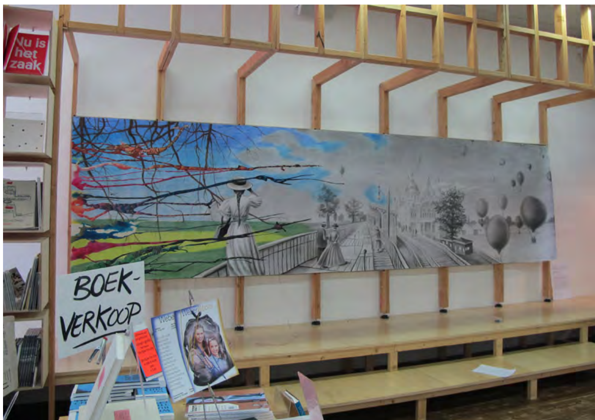
OpZicht: Arike Gill, Le Palais de l'électricité