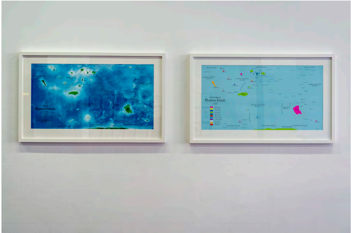
Tentoonstelling: Agnieszka Kurant exformation