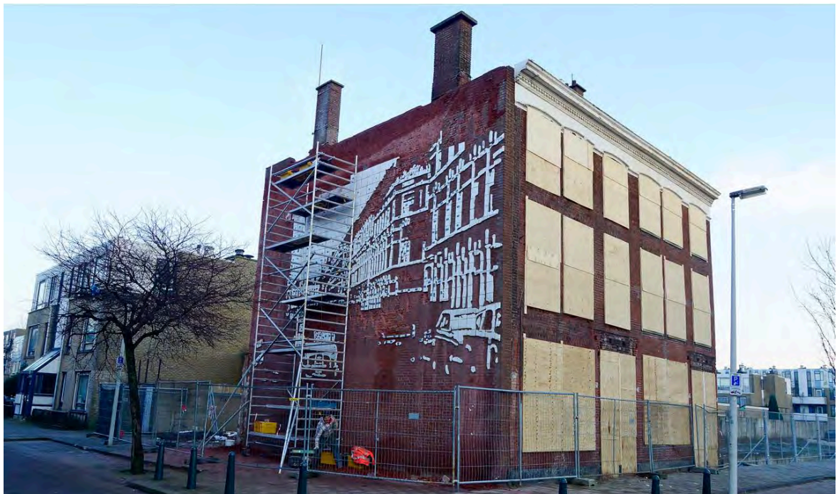
Behoud muurreliëf Reconstructie Teniersstraat van Berry Holslag in de Schilderswijk (foto: Comité Behoud Kunstwerk Berry Holslag Schilderswijk)