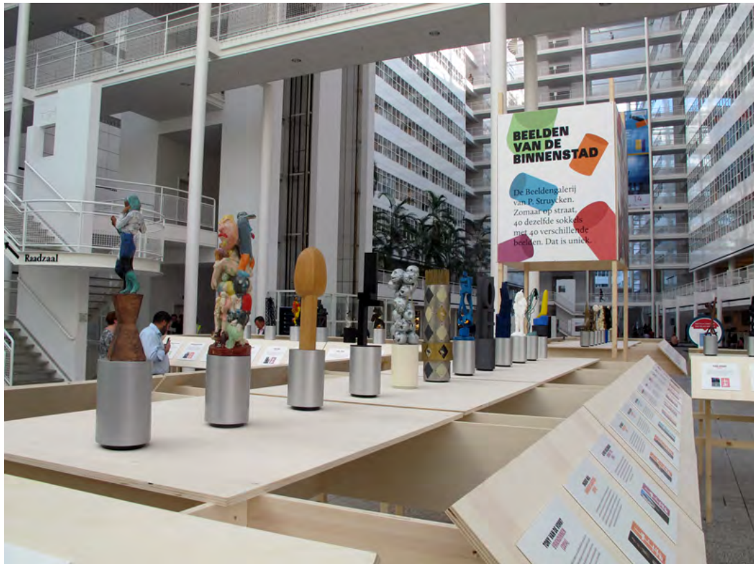
Tentoonstelling Beelden van de Binnenstad in Atrium Den Haag