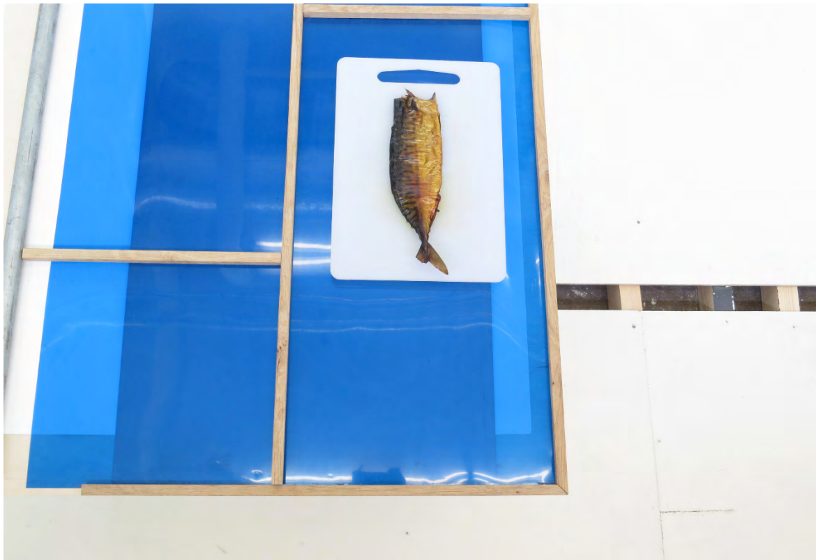
Stroom Aanmoedigingsprijs 2014: Santeri Taurula, zonder titel