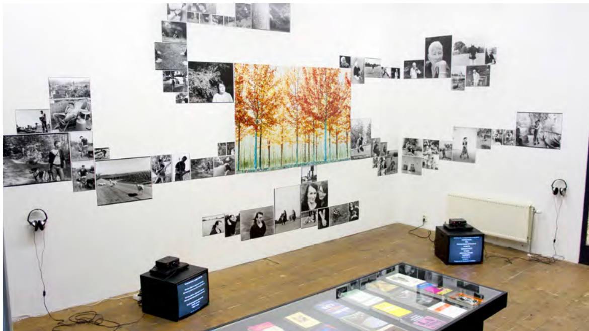
Ondertussen: Risk Hazekamp, nul acht fü n z eh n