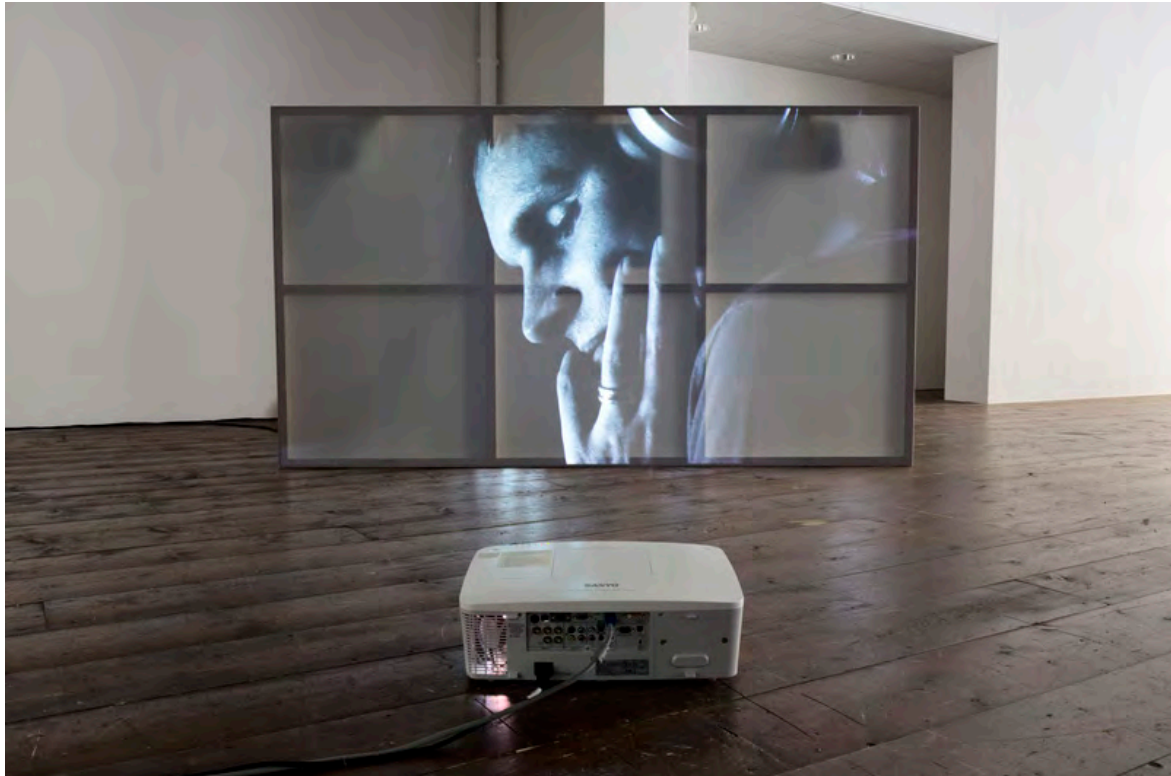
Tentoonstelling A Glass Darkly : Imogen Stidworthy, Sacha