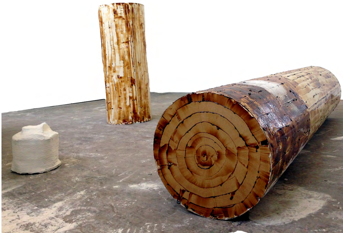
Stroom Aanmoedigingsprijs 2014: Hannah Polak, Panacea