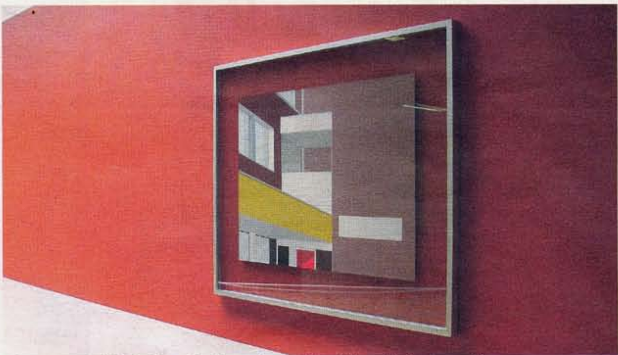
Toby Paterson: 'Bibliotheek', acrylverf op papier, 2007.