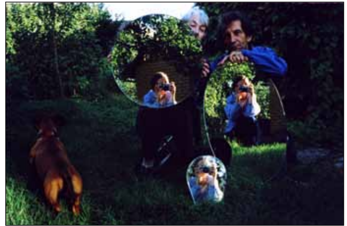
Ksenia Galiaeva, Untitled , 2011, analoge kleuren- foto

Th – Ik heb nog nooit aan die vergelijking gedacht bij mijn tafels. De vrouw die op de tafel zit zou je een figuur in amazonezit kunnen noemen. Wanneer je paardenbuiken met de onderkanten van tafels vergelijkt zijn beide niet bijzonder interessant, toch?