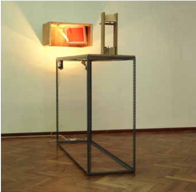
Thom Puckey, Report from the Childrens' Club , 1987 Diverse materialen 217 x 80 x 284 cm Collectie: Narcisse Tordoir, Antwerpen