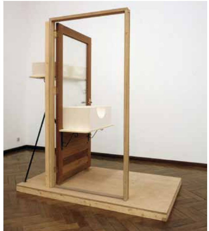
Thom Puckey, Spinoza , 1988 Diverse materialen 210 x 200 x 122 cm