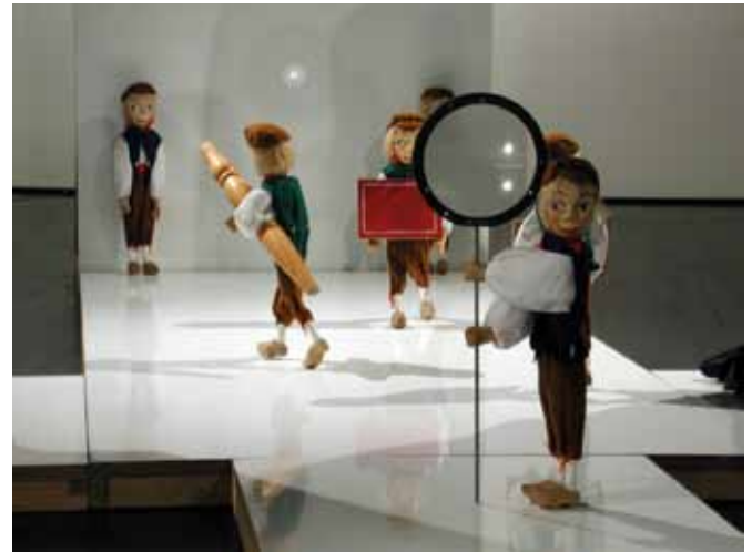
Thom Puckey, True Light , 1987-88 Diverse materialen 1300 x 300 x 200 cm