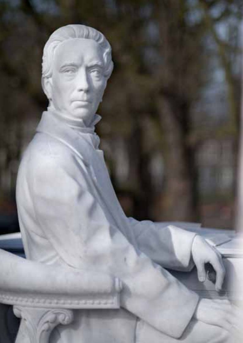
Thom Puckey, Thorbecke monument in Den Haag (detail), 2017