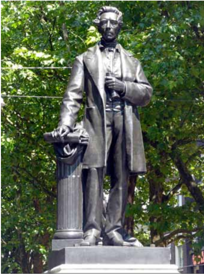
H.A. Leenhoff, Thorbecke standbeeld in Amsterdam, 1876