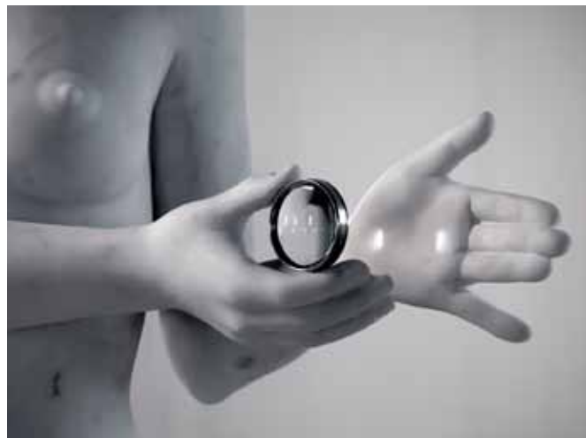
Thom Puckey, Treachery , 2013 Statuario marmer, lens 122,5 x 64 x 165 cm