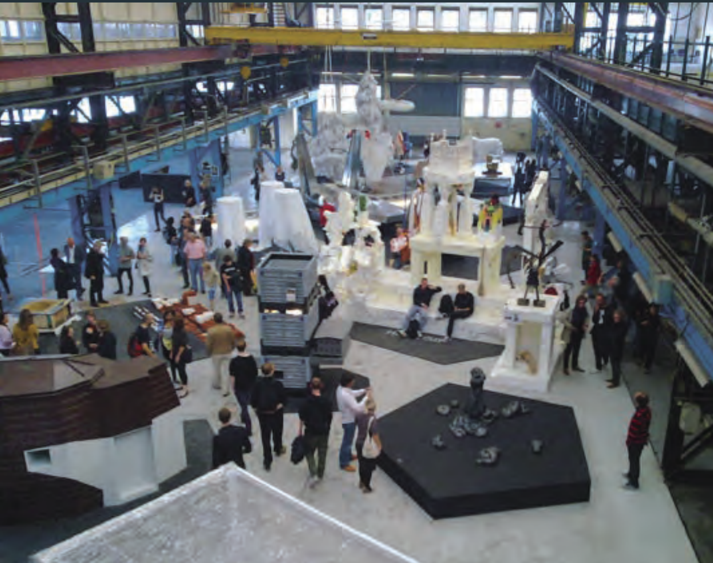
Beeld Hal Werk, Amsterdam Open Air Fitness Honk David Bade

die gelieerd zijn aan bijvoorbeeld voedselproductie, duurzaamheid, klimaat, ..... (...) Zo buigt kunst- en architectuurcentrum Stroom Den Haag zich voor het tweede opeenvolgende jaar met het programma 'Foodprint' over de invloed van voedsel op de cultuur, de inrichting en het functioneren van de stad. (...) Je zou kunnen stellen dat de werkwijze en het programma van Stroom Den Haag impliciet fungeren als een departement Onderzoek en Ontwikkeling van de overheid. (...) Activiteiten van culturele instellingen als Stroom Den Haag kennen een uitdrukkelijk ondernemend karakter, waarbij de instelling