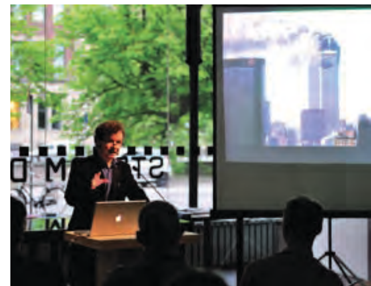
Lezing Dario Gamboni

De kunstenaar Florian Göttke nam eerder deel aan het project 'Werkplaats Thorbecke' bij Stroom (2009) vanwege zijn interessante visie op verschijnselen als acculturatie en hergebruik met betrekking tot monumenten. De verschijning van Göttke's publicatie 'Toppled' was aanleiding om de gerenommeerde Zwitserse kunsthistoricus, auteur en curator Dario Gamboni uit te nodigen. Deze gaf een lezing over het 'asymmetrisch conflict', een term die sinds de moedwillige verwoesting van het World Trade Center op 11 september 2001 in zwang is geraakt. Bestaat er een verband tussen de mate van asymmetrie in een conflictsituatie en de neiging van de 'zwakkere' partij om zijn toevlucht te nemen tot iconoclasme? Florian Göttke verzorgde later in het jaar, tijdens LOKO10, een lezing naar aanleiding van 'Toppled' (zie p. 23).