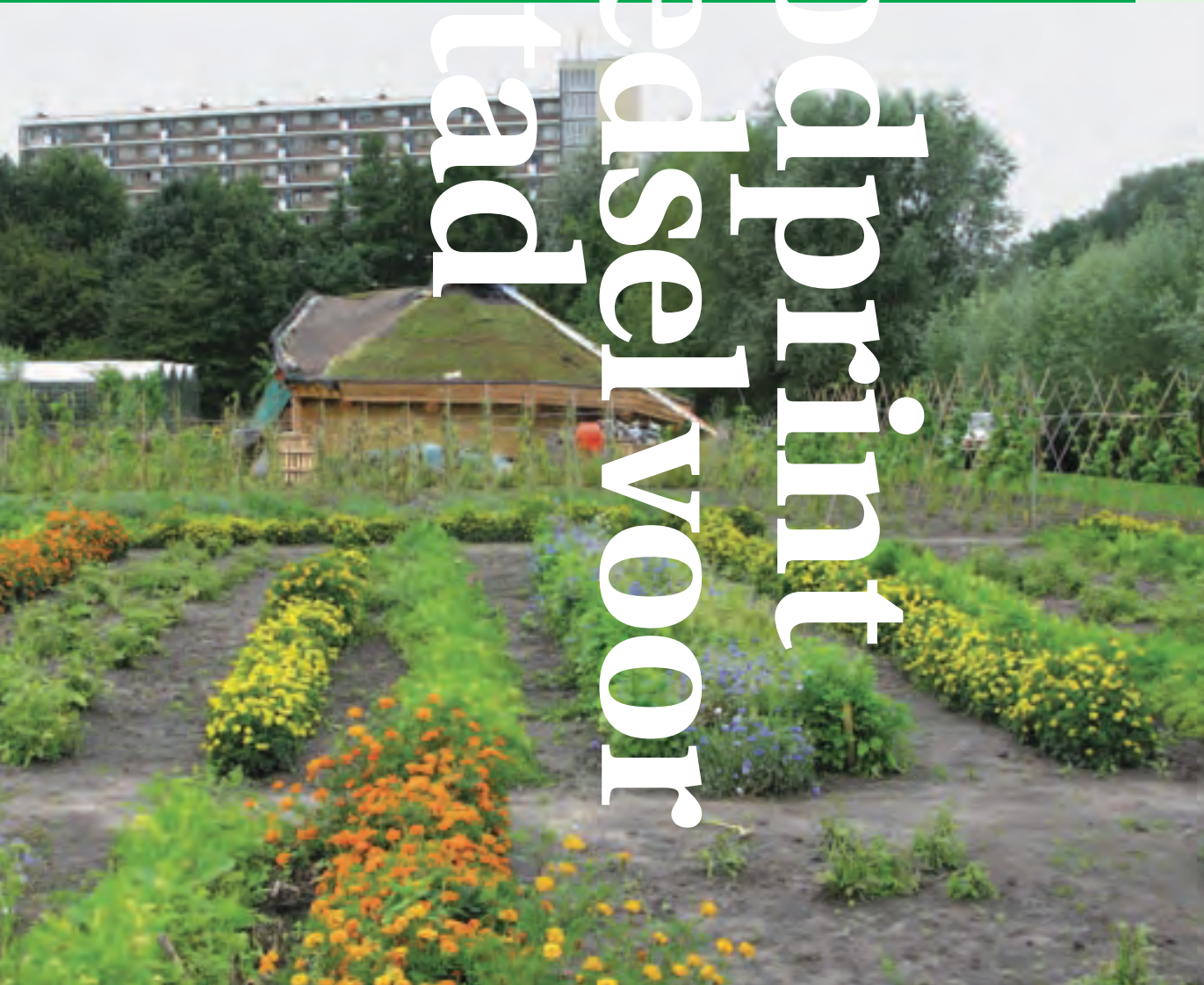
Eetbaar Park Nils Norman

'Foodprint. Voedsel voor de stad' is een meerjarig programma dat Stroom Den Haag in 2009 is gestart en dat zich richt op de invloed van voedsel op de cultuur, de inrichting en het functioneren van steden en van Den Haag in het bijzonder. Het programma heeft zowel een artistieke component als een duurzaamheids/milieucomponent en dient in