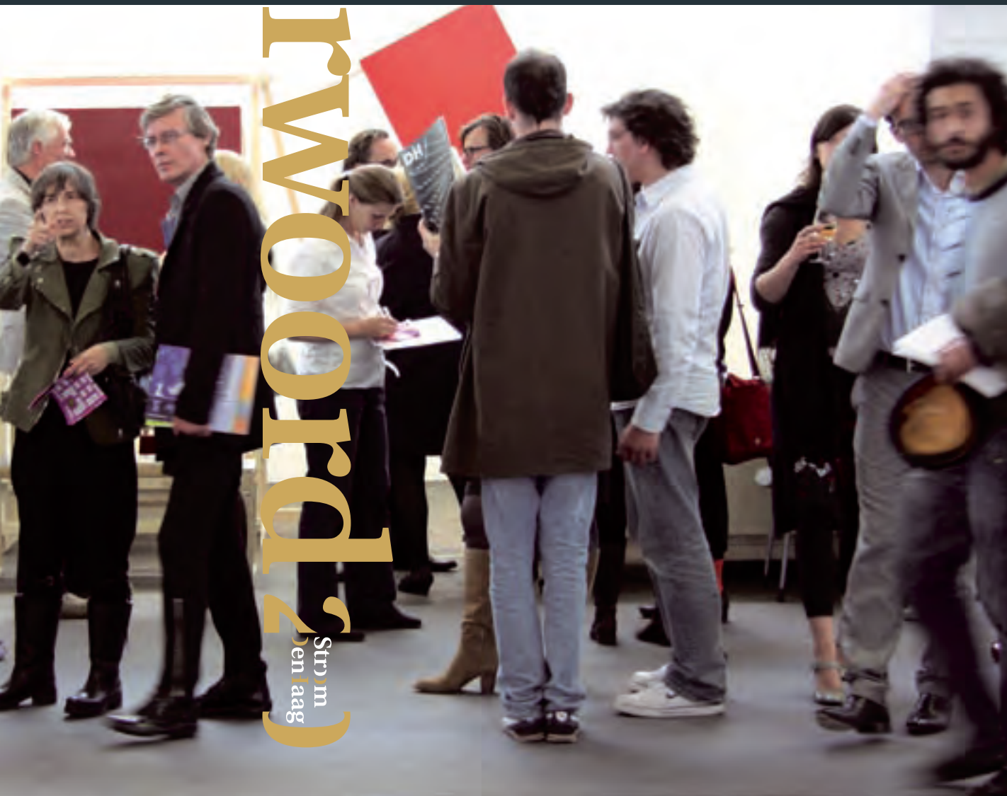
Stroom stand op Art Amsterdam