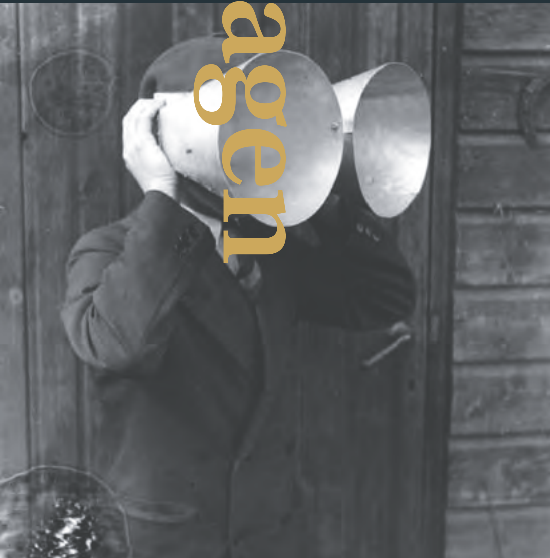
Hoorns met evenwijdige assen Collectie Museum Waalsdorp