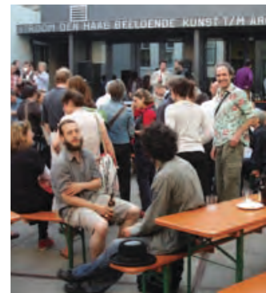
Test Assembly Opening