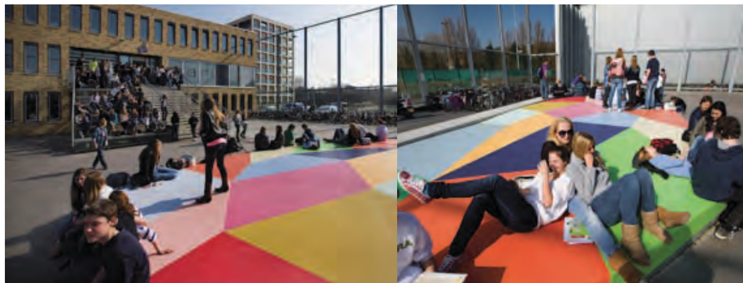
Maris College Houtrust