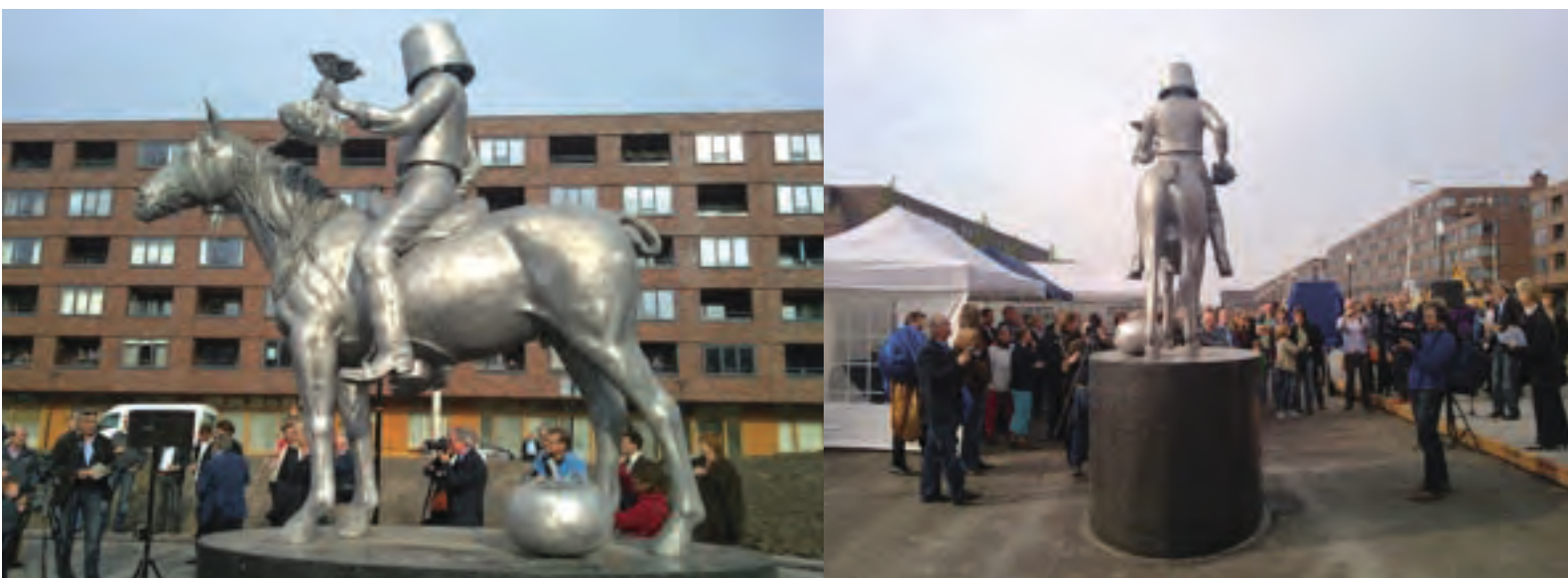
John Wayne QS Serafijn