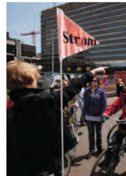
Atelierroute per fiets

Stroom Den Haag streeft met haar atelierbeleid naar een goed en betaalbaar atelier voor iedere beeldend kunstenaar in Den Haag. In samenwerking met de gemeente nam Stroom de deelnemers mee naar enkele prachtige en inspirerende woon/werkateliers die ze tijdelijk in beheer heeft. Onder begeleiding van een gids werden panden rondom het centrum bezocht, waaronder De Besturing, Stichting Centrum en enkele woonateliers in Transvaal en Rivierenbuurt. Kunstenaars vertelden en toonden hun werkplek, er waren muzikale performances, installaties en exposities. De route werd afgesloten met een borrel in Ateliercomplex Delta.