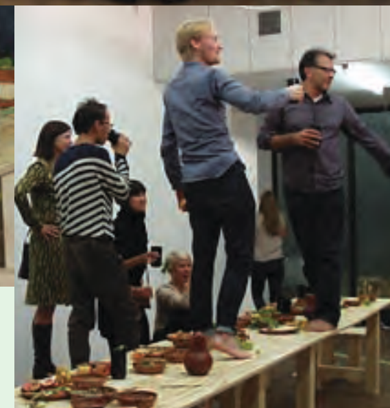
The Last Supper Raul Ortega Ayala