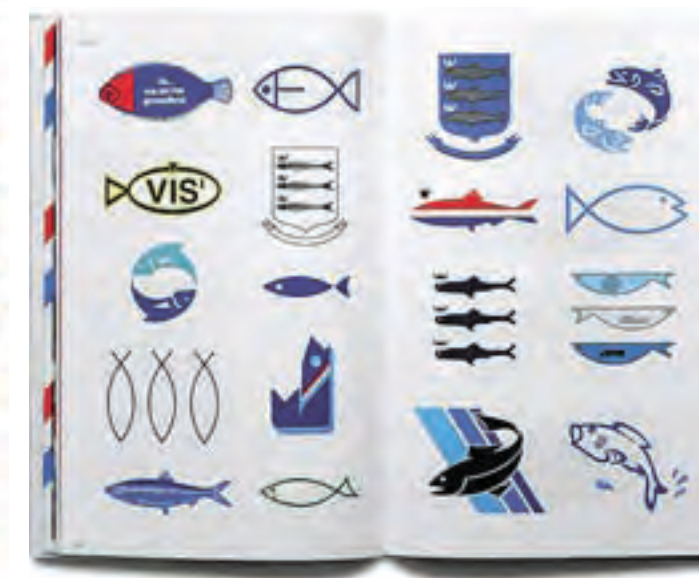
SCH Forever Publicatie