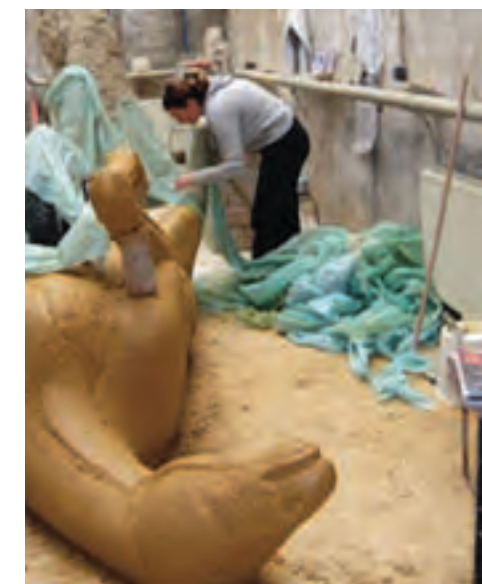
Boven het Land, atelier Ingrid Mol