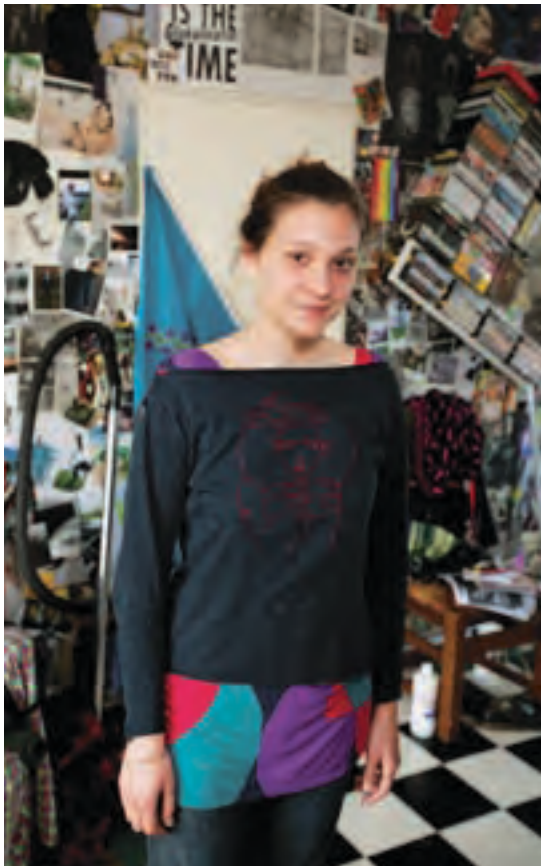
Kunstenaars in atelierwoningen in Transvaal en Rivierenbuurt