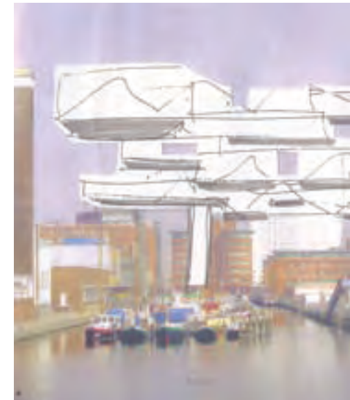
Ville Spatiale in De Binckhorst Yona Friedman